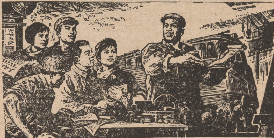
UN GRUPO TEORICO DE OBREROS EN LA REPUBLICA POPULAR DE CHINA.

La Federación Americana Laboral por supuesto despues traicionó a la clase obrera y colaboró con la burguesía en promoviendo "Labor Day" en septiembre como el día de fiesta de los trabajadores. Han tratado de separar al proletariado de los EE.UU. de sus hermanos y hermanas internacionales y substituir un día inofensivo de jiras, en vez del gran día de solidaridad internacional de clase.