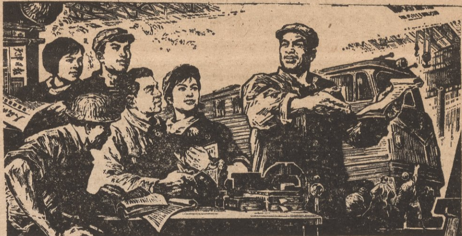
A workers' theoretical group.

"No, I don't consider these people to have been found guilty of any offense but they must be hanged, I'm not afraid of anarchy; Oh, no, its the Utopian scheme of a few philanthropic cranks, who are amiable withal, but I do consider that the labor movement must be crushed. The Knights of Labor will never dare to create discontent again if these men are hanged". (Foner-page 111)