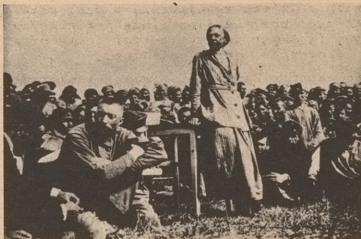
Krupskaya addressing soldiers during the civil war.

Tonight we must struggle tit for tat on all class questions.