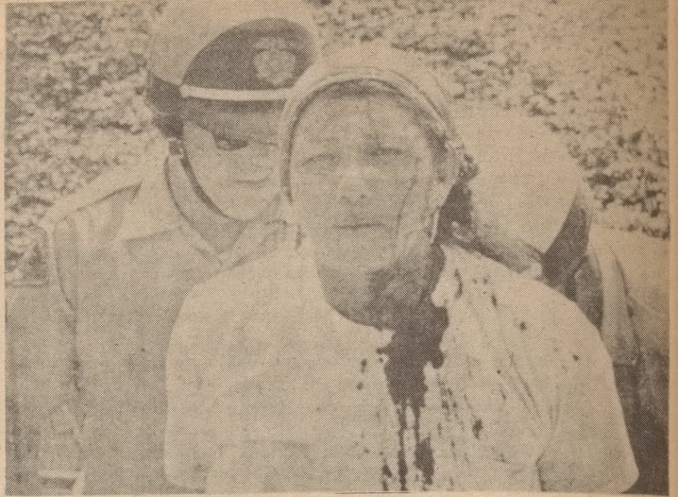
WORKING WOMEN, LIKE THE FARM WORKER SHOWN HERE, CONTINUE TO SHED THEIR BLOOD FOR THE CAUSE OF THE WORKING CLASS.

brings with it an improvement in the position of women. The movement for the emancipation