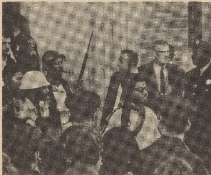
Armed Black students leave occupied building on Cornell University campus, 1969.

U.S., the struggles of the U.S. working class as seen in the rise of strikes, walkouts, demonstrations, etc. against the capitalist class, and the struggles of the Black nation, oppressed nationalities and toiling masses have sharpened. For the student-youth movement there has already begun an upsurge against the various manifestations of the imperialist crisis, as seen in the militant protest movement against the rising costs in colleges and high schools, against the cutbacks, attacks on oppressed nationalities and the rising fascist menace as seen in the racist theories of Shockly, rise in political repression as in Brooklyn College, and police murders of Black, Chicano, and Puerto Rican youth.