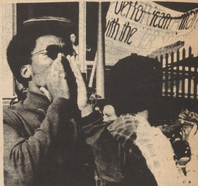
Demonstration called by Anti-Imperialist Coalition at Brooklyn College in support of students brought up on disciplinary charges by administration.

However, the Brooklyn College students did not retreat under the attack. Instead, they intensified