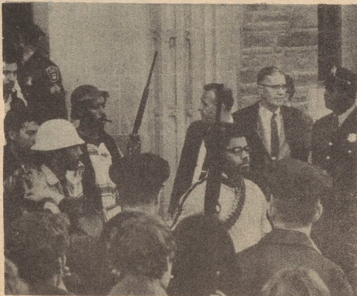
Estudiantes Negros armados salen del edificio ocupado por ellos en el campus de Cornell University, 1969.

decayente. El pueblo indochino ha sido victorioso. Asia, Africa y América Latina se encuentran en llamas con el fuego de revolución. Domésticamente, las luchas de la clase obrera, la nación afro-americana, las nacionalidades oprimidas y las masas trabajadoras contra la clase capitalista han agudizado, como muestra la gran cantidad de huelgas, los paros de trabajo y las demostraciones. Para el movimiento de los estudiantes y la juventud, ya ha comenzado un levantamiento contra diferentes manifestaciones de la crisis imperialista.