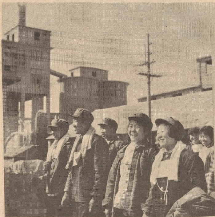
There is no unemployment in China

Coming right after the end of World War II, the establishment of the People's Republic of China was part of the rising tide of national liberation struggles in Asia, Africa and Latin America. It also represented a tremendous loss to the U.S. imperialists. Not only did they lose the opportunity to continue to exploit and plunder the resources and markets of China (600 million people at that time), but from that point on China became a source of guidance, inspiration, and support to revolutionaries and oppressed people. This has taken many forms, from concrete help, to lessons in strategy and tactics, to political support on the international level, to the struggle against modern revisionism. The Chinese Revolution has been an outstanding example of how the reserves of imperialism were turned into the reserves of the international proletariat. (see Stalin, Foundations of Leninism , "Strategy