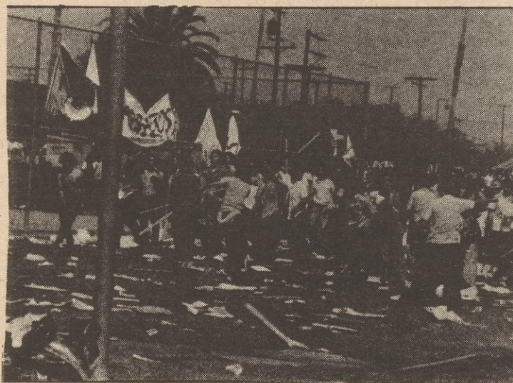
Chicano Moratorium against the war August 29, 1970.

"Comrades, on nearly every question regarding the party, RU's line either openly or covertly refutes and revises the teachings of Lenin on the party. RU's line tails spontaneity, is economist, belittles