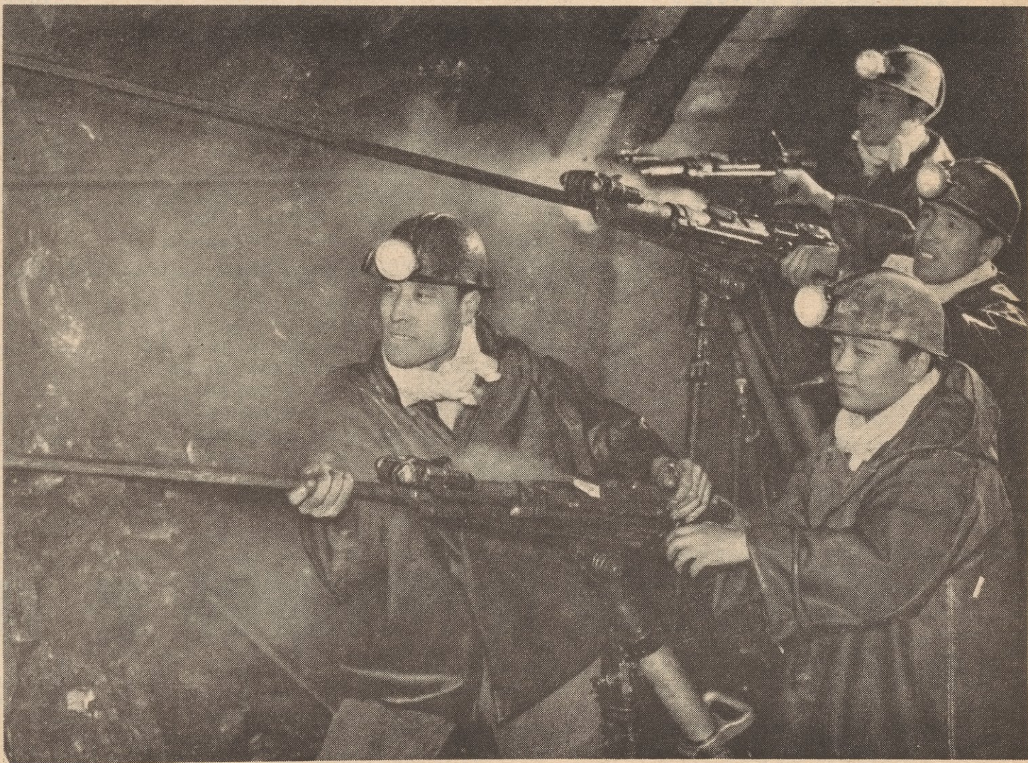
Known as the "pioneers", members of the youth shock brigade, Chaokochuang mine, at work.