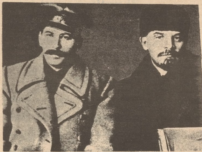
Stalin and Lenin

Han transcurrido 58 años desde la revolución; cuando el gran Lenin y su más avanzado discípulo, José Stalin, dirigieron al partido bolchevique, dando dirección al proletariado y a las masas oprimidas a tomar el poder estatal y así establecer la dictadura del proletariado. Esta, la más grande victoria del proletariado internacional, marcó el principio del fin del orden capitalista en el mundo. Sacudiendo los cimientos del capitalismo, el proletariado ruso se liberó del yugo de la opresión y se dispuso a la