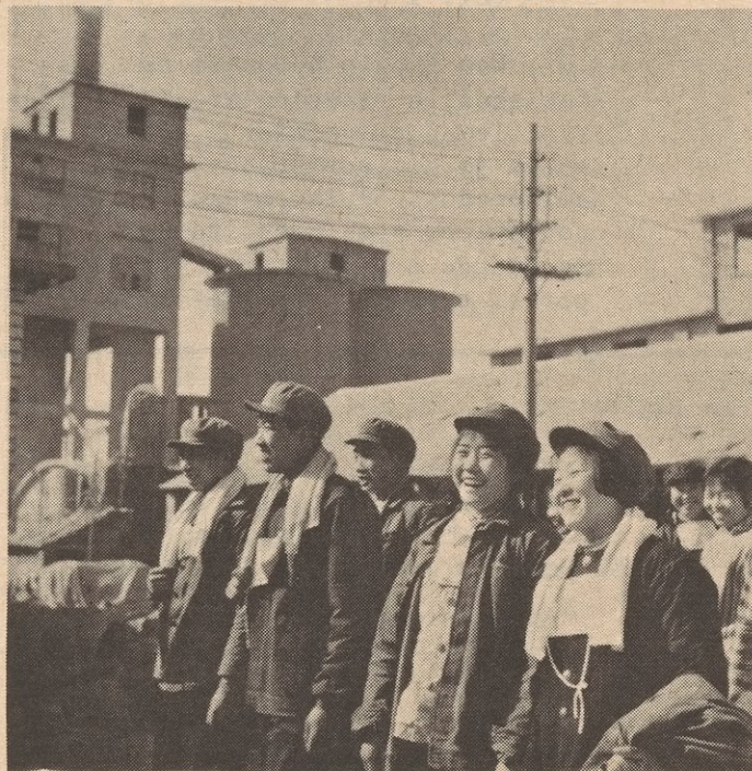
No existe el desempleo en China

Inmediatamente después de la Segunda Guerra Mundial, el establecimiento de la República Popular China fue parte de la creciente marejada de luchas de liberación nacional en Asia, Africa y Americana Latina. También representó una gran pérdida para los imperialistas de los EE.UU. No sólo perdieron la oportunidad de seguir explotando y saqueando los recursos y los mercados de China (600 millones de habitantes en aquel tiempo), pero desde ese momento, China se convirtió en guía, inspiración y apoyo a los pueblos revolucionarios y oprimidos del mundo. Esto ha tomado muchas formas, desde ayuda concreta, a lecciones en estrategia y tácticas, a respaldo político a nivel internacional, a la lucha contra el revisionismo moderno. La revolución China ha sido un ejemplo de cómo las reservas del imperialismo moderno. La revolución China ha sido un ejemplo de cómo las reservas del imperialismo moderno fueron convertidas en reservas de proletariado internacional. (ver "Fundamentos del Leninismo" de Stalin, "Estrategias