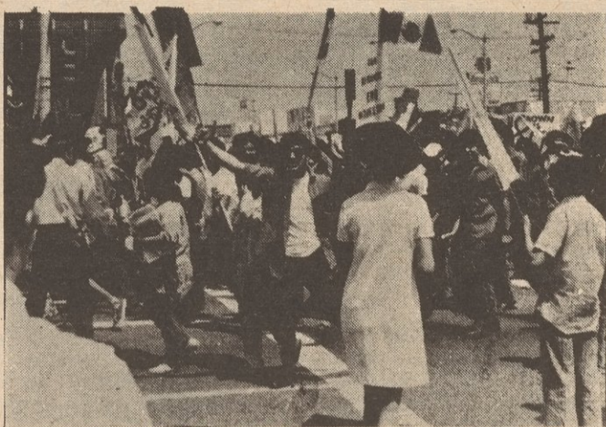
The ATM takes its name from the Chicano Moratorium Against the Vietnam War shown above.

On September 21, 1975, 250 people participated in a forum on Party Building held by the August 29th Movement in NYC. After the presentation by the ATM, entertainment was provided by the revolutionary songs of the Socialistics, members and friends of the PRRWO. (see centerfold). Questions and answers followed. What follows are excerpts from the introductory statement by the PRRWO, and parts of the presentation by the ATM.