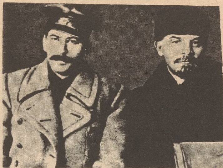
Stalin and Lenin

"It would be naive to wait for a formal majority for the Bolsheviks. No revolution ever waits for that. Kerensky and co. are not waiting either, and are preparing to surrender Petrograd. It is the wretched waverings of the Democratic conference that are bound to exhaust the patience of the workers of Petrograd and Moscow! History will not forgive us if we do not assume power now. There is no apparatus? There is an apparatus, the Soviets and the democratic organizations. The international situation right now on the eve of the conclusion of a separate peace between the British and the Germans is in our favor. To propose peace to the nations right now means to win." (Lenin, Collected Works , Vol. 26, p.21)