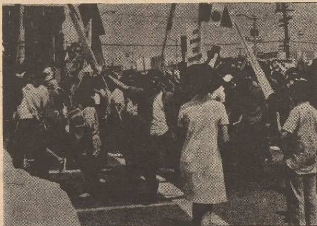
MORATORIO CHICANO CONTRA LA GUERRA agosto 29, 1970

"Vivimos hoy en una crisis imperialista que se empeora cada día mas. El proletariado multinacional de los EE.UU., ha respondido a la actual intensificación de esta crisis con una ola de huelgas, manifestaciones y rebeliones a través de todo el país. Sin embargo, como todos sabemos, el proletariado