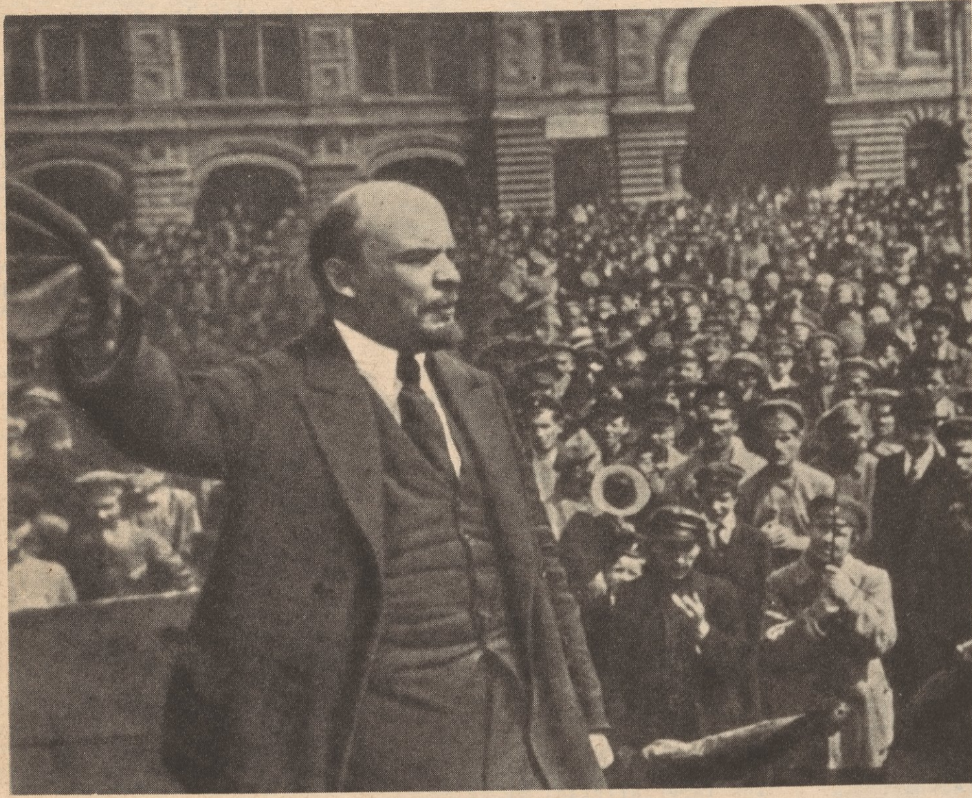
Lenin addresses the Vsevoluch troops on the Red Square, May 25, 1919