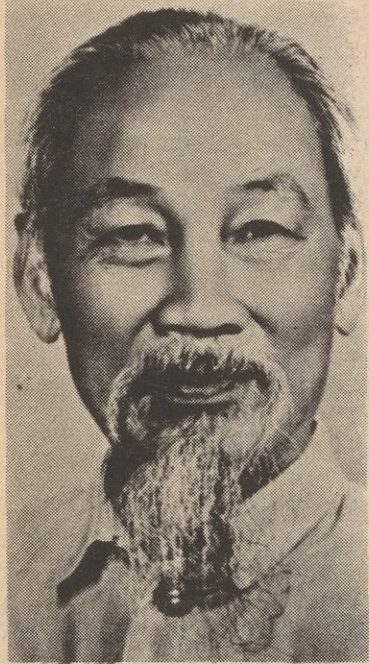
Ho Chi Minh