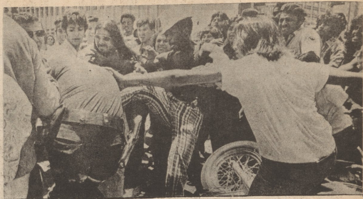
Murders and brutality by the police increase as the bourgeoisie tries to put the burden of the imperialist crisis on the backs of the proletariat and masses of people, and attempts to crush the revolutionary upsurge. Above, demonstration protesting the police murder of a young Chicano brother in Dallas, Texas, July 1973.

The key thing to understand is that the role of the bourgeois state is to, through violence and coercion, "stabilize" the existing order and prevent the irreconcilable contradictions between the proletariat and the bourgeoisie from resolving itself through proletarian revolution. That's why its apparatus gears up when capitalism is in a crisis, like what is happening today. The bourgeoisie knows the people are rising in a great social upheaval and that they must come down hard, especially through use of the state, to forestall their ultimate collapse.