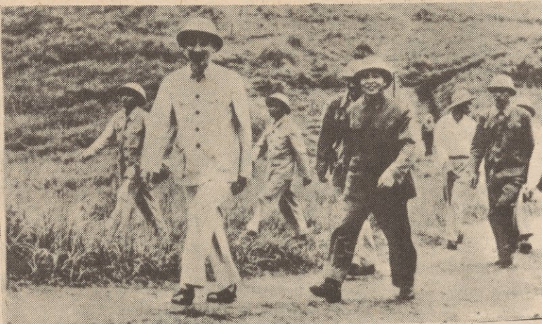
El Genral Giap y el Presidente Ho participando en maniobras de una de las divisiones en el instituto militar en la providencia Son Tay (1957)

Claramente, los revisionistas soviéticos y su portavoz, el P.C.E.U. (Partido Comunista de los EE.UU.), están tratando de convencer a los pueblos del mundo, que desde la derrota del imperialismo norteamericano en Viet Nam los EE.UU. han cambiado su naturaleza fundamental - se han convertido en más razonables, y están dispuestos a retirarse para lograr así un relajamiento en las tensiones, y luego entonces la posibilidad de una transición pacífica al socialismo está ahora en existencia.