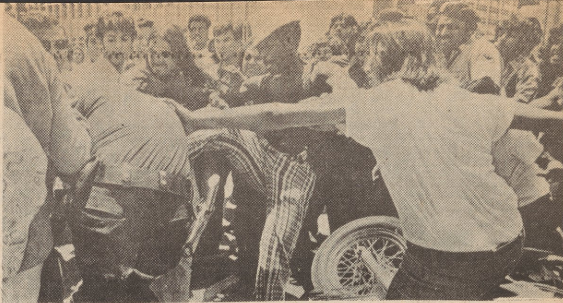
Asesinatos y brutalidad policiaca intensifican cuando la burguesía trata de poner la carga de la crisis sobre los ombros del proletariado y las masas trabajadoras y atenta aplastar el levantamiento revolucionario. Arriba, manifestación protestando el asesinato policiaca de un hermano joven chicano en Dalas, Tejas, julio 1973.

Lo importante es entender que el papel del estado burgues se "estabilizar" a travez de la coerción y la violencia, el régimen actual y prevenir que la contradicción irreconciliable entre la burguesía y el proletariado no se resuelva con la revolución proletariada. Esta es la razón por la cual su aparato se pone en marcha cuando el capitalismo está en crisis, como hoy. La burguesía sabe que los pueblos se estan levantando en un gran movimiento social, y que la represión tiene que ser fuerte, especialmente al usar el estado, para así retrazar su colapso final.