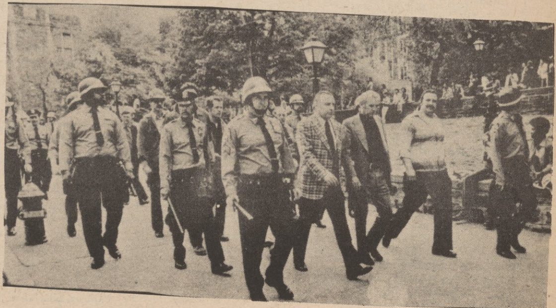
(Arriba) vemos la policía escoltar a burócratas sindicalistas de la construcción al salir del recinto universitario de CCNY en New York luego de que matones asalariados de la unión atacaron a obreros afro-americanos y puertorriqueños quienes exigían un fin a la discriminación en empleos.