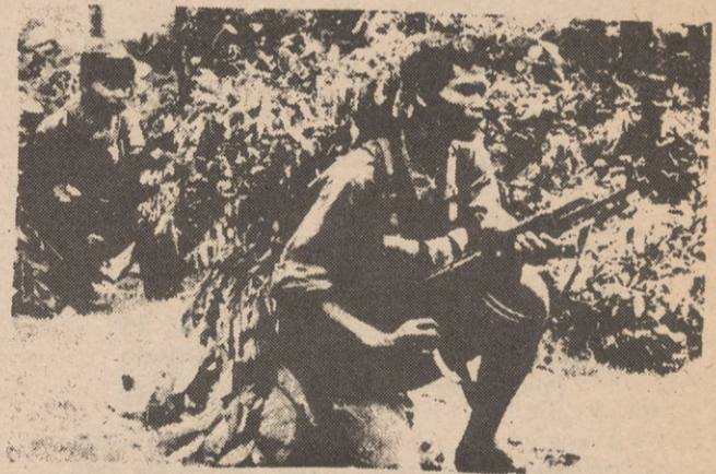
Uniéndose al Ejército de Liberación -- Trabajadores de suministros sirven al frente en una zona liberada.