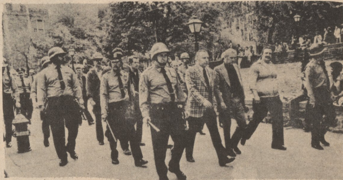
Above, police escort construction union bureaucrats off CCNY campus in NY after union-paid goons attacked Black and Puerto Rican workers demanding end to discrimination in hiring.