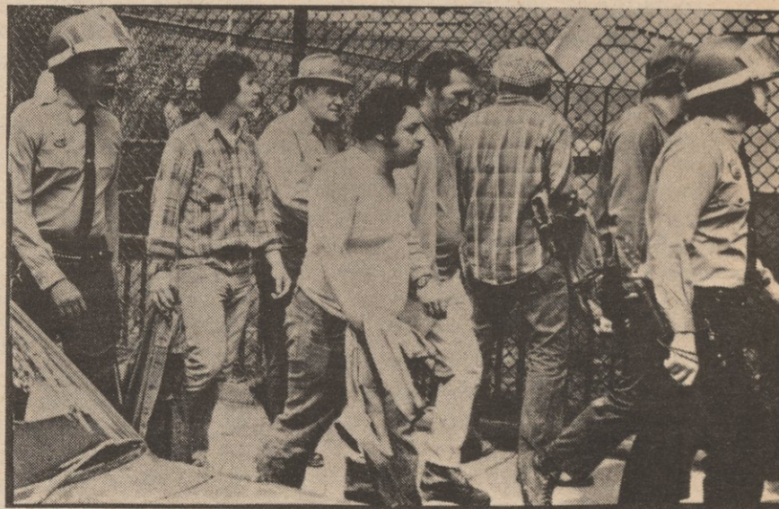
The proletariat is face to face with the bourgeoisie, steel to steel. Above (left) the workers of Manhattan North Coalition (NY) demand jobs. (right) The hired goons of the construction union who later attacked workers and students at CCNY.

It is not incorrect for communists to make economic demands such as higher wages, cost of living clauses, union democracy, and so on, while at the same time putting forward the advanced line and truly exposing the nature of capitalism. It is not the task of communists to simply record history, or engage in descriptive narratives borrowed from the bourgeoisie, but to change history, analyze concrete conditions, show what is old and dying out and what is coming into being.