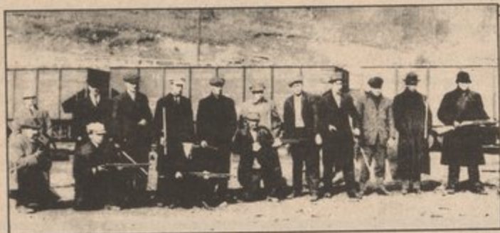
STRIKING AMERICAN MINERS TOOK UP ARMS DURING THE DEPRESSION

The 8-hour movement grew in intensity and scope as workers united to demand: "8 hours' work, 8 hours rest, 8 hours recreation." The capitalist-owned press responded by condemning the 8-hour movement as "communism, lurid and rampant." They warned that the 8-hour movement was "un-American" and instigated by "foreigners." A shorter workday, they said, would only cause "loafing, and gambling, rioting, debauchery and drunkenness." All this was done to cover up and maintain the situation whereby the longer workers slaved, the more profits they produced for the capitalists.