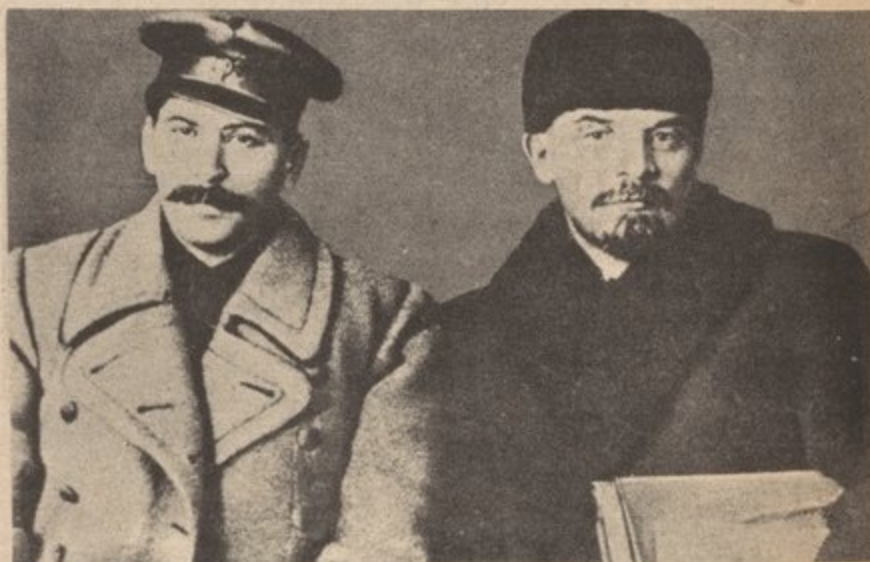
Stalin and Lenin

We must resolve on the basis of Marxism-Leninism line struggle on the United Front Against Imperialism, on the National Question. We must have understanding and unity on an analysis of classes of U.S. society. We must resolve what indeed is the military strategy for proletarian revolution.