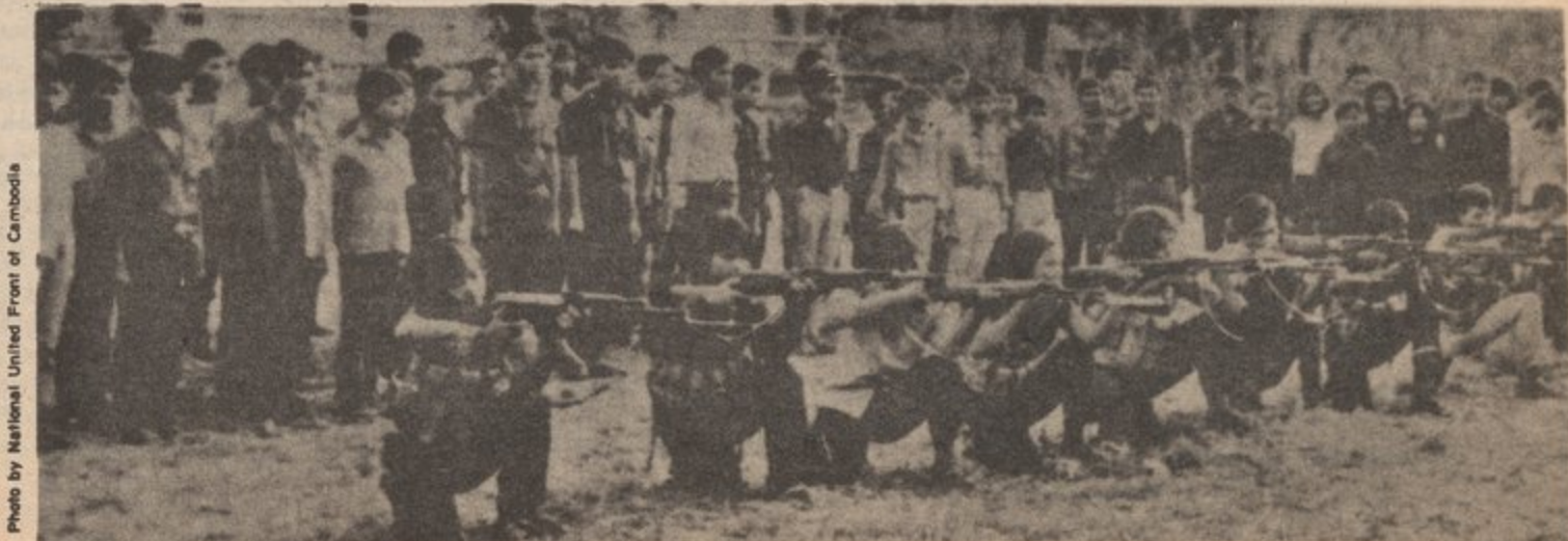
Target practice for the people in a liberated area of Cambodia.

¡QUE VIVA LA LUCHA VICTORIOSA DEL PUEBLO VIETNAMITA Y CAMBOYANO !