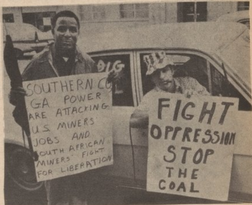
THE Working CLASS PERMANENTLY CANNOT SOLVE ITS PROBLEMS WITHOUT DESTROYING THE CAPITALIST SYSTEM

capitalists, to abolish the private ownership of the means of production, is to take political power away from the capitalists by smashing the bourgeois state and establishing the dictatorship of the proletariat. When the advanced representatives of the working class have mastered the ideas of scientific socialism, the idea of the historical role of the American working class, when these ideas become widespread, when the workers have their party--then the spontaneous economic struggles of the workers will be transformed into a conscious class struggle to seize state power.