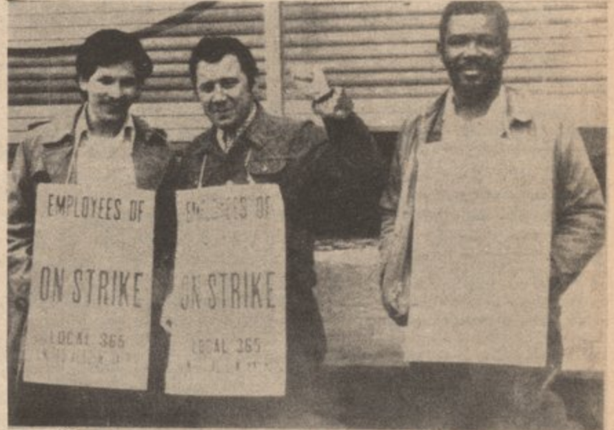
THE MULTINATIONAL U.S. WORKING CLASS HAS GONE INTO ACTION AGAINST THE ATTACKS BY MONOPOLY CAPITALISTS

Already we have seen the growing response to these cuts as thousands of workers, parents, and community supporters from the areas of hospitals and day care have militantly taken to the streets in NY. In addition, the college campuses are beginning to heat up once again. In the period of two weeks, demonstrations and takeovers have occurred in Brooklyn College, Lehman College, City College, Fordham University (all in NY); Seton Hall, New Jersey; and Brown University in Rhode Island.