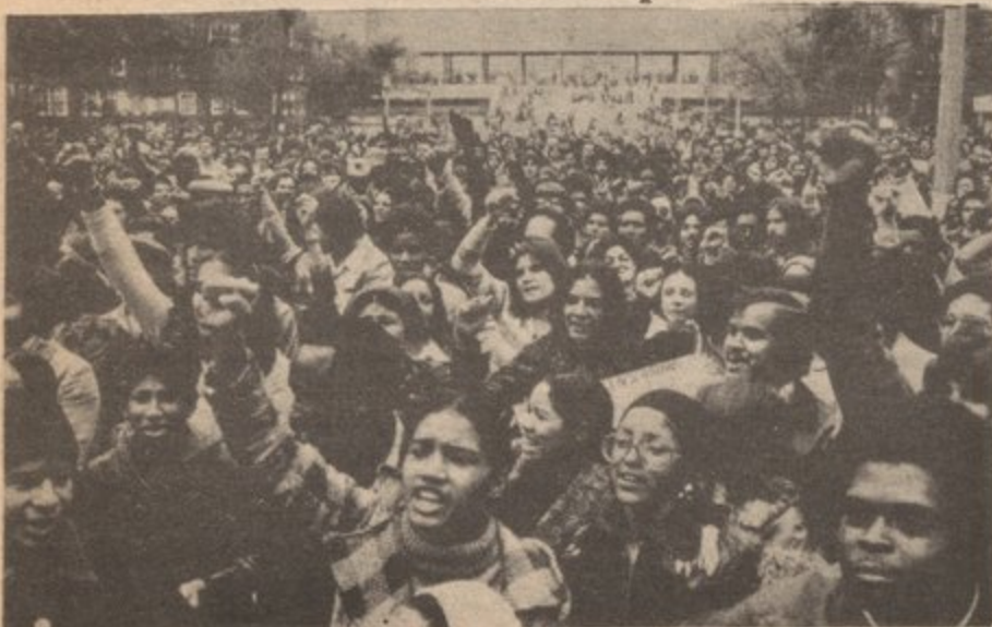
STUDENTS AT BROOKLYN COLLEGE N.Y. DEMONSTRATE AGAINST ADMINISTRATION ATTACKS ON PUERTO RICAN STUDIES

In the area of budget cuts, Ford has proposed a massive cut of $4.6 billion from the federal budget. The biggest chunk is coming out of the area of health, education and welfare. This hits hardest at oppressed nationalities, old people and youth--medicaid, medicare, hospital and clinic services, daycare, school budgets, special educational programs, financial aid for college students, emergency housing repairs, drug programs, and poverty programs of all kinds.