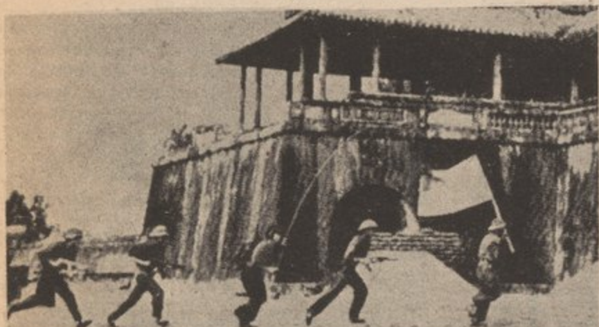
"Tropas Comunistas Agarran Poder Del Palacio Regio en Hue."

En el proximo Palante publicaremos mas informacion sobre el desarrollo de la lucha en Vietnam.