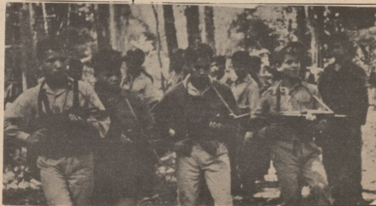
Cambodian patriotic troops training in the liberated zone of Cambodia.