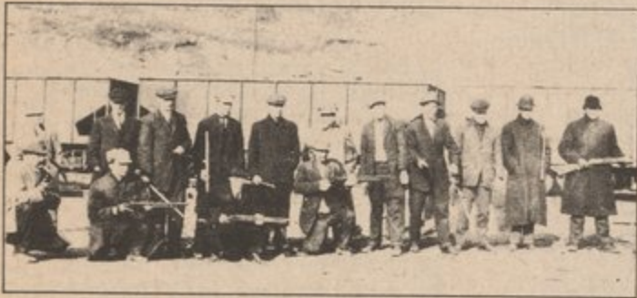
"Americanos Mineros En Huelga Cogieron Armas Durante La Depresión."

La historia del Primero de Mayo se remonta al 1886 cuando esta fecha fue escogida para empezar la gran lucha mundial por conseguir el derecho a jornada de ocho horas diarias, siendo esta lucha dirigida por el proletariado de los Estados Unidos. Esta década de los 1880, vio el rápido desarrollo de la industria americana a su etapa más alta-- el capital monopolista. Este desarrollo fue acompañado por la intensificación de la explotación de la clase obrera, los salarios de hambre y jornales agonizantes de 14 a 16 horas diarias. En esta lucha contra los intentos capitalistas de convertirlos en bestias de carga, los trabajadores americanos empezaron a organizar y agitar para conseguir un jornal diario más corto.