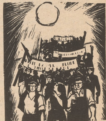
Fraternal Greetings to the Albanian Party on their 30th Anniversary of the Founding of The People's Republic of Albania and the 34th Anniversary of the Party of Labour of Albania.

The socialist countries didn't achieve their liberation peacefully, nor did it just happen. It was brought about through the formation of a genuine communist party which led an armed struggle for the overthrow of the capitalist class by the working class and its allies. As in the socialist countries before their successful revolutions--in the U.S., it means wanting freedom, a decent life for not only ourselves, but for our children and our children's children--wanting this enough to organize and fight for it.