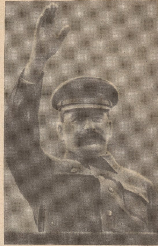
J. V. STALIN

All revolutionaries and freedom-loving people remember Stalin as a great revolutionary and an outstanding Marxist-Leninist who devoted his whole life to the defense of the victories of the October Revolution and of the construction of socialism in the Soviet Union, to the cause of the liberation of the proletariat and all the oppressed peoples of the world.