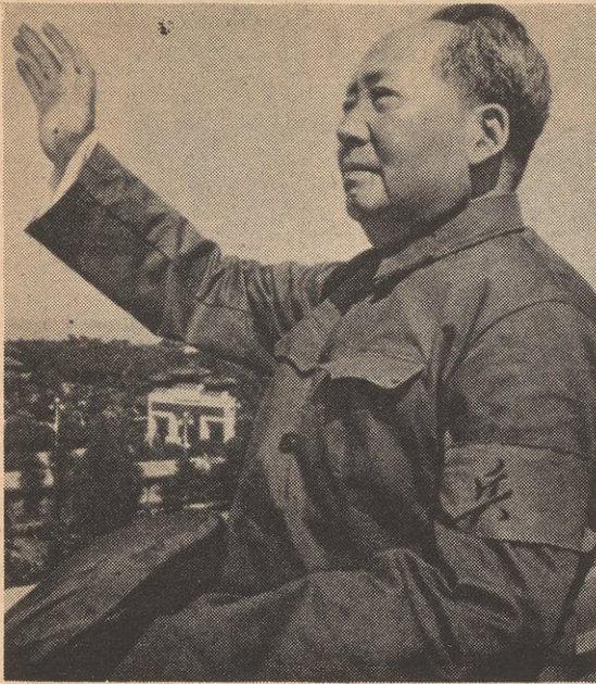
MAO TSE TUNG