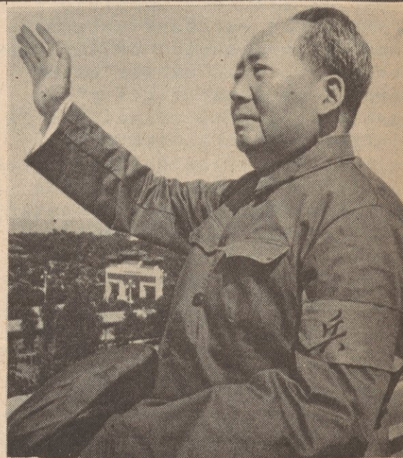
MAO TSE TUNG (Nacido diciembre 26, 1893)

Este cumpleaños del presidente Mao es una nueva inspiración de enseñanza de este camarada, luchar como él, dedicar nuestras vidas a la destrucción del imperialismo, socio-imperialismo, y a todos reaccionarios, luchar infatigablemente por la dictadura del proletariado, levantar más alta la bandera de Marx, Engels, Lenin, Stalin y Mao Tse Tung.