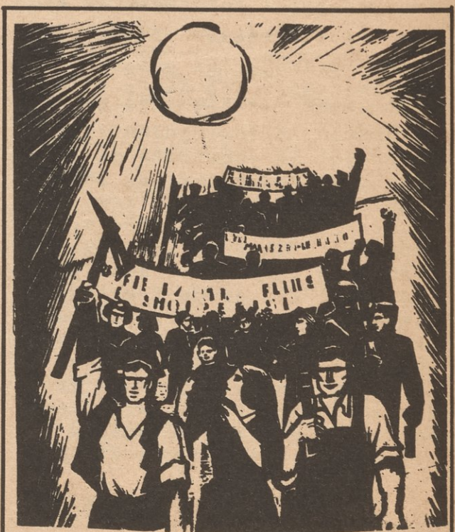
Saludos Fraternalmente al Partido de Albania en su 30 aniversario de la Fundacion de la Republica Popular de Albania y el 34 Aniversario del Partido de Labor de Albania.

Mao Tse Tung, En Apoyo a la Lucha Afro-Americana contra la Represion Violenta