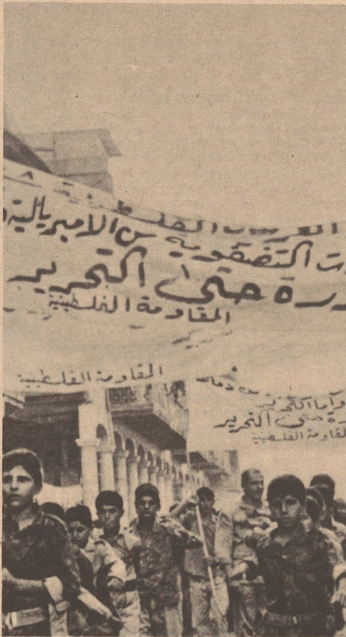
Los guerrilleros Palestinos en Bagdad denuncian ferozmente el imperialismo de E.U. por su intriga criminal al tratar de destruir la lucha armada del pueblo Palestino.

muerdos en menos de dos semanas. Mas, a pesar de todo ello, el rey Hussein fracasó en su intento de liquidar la existencia pública de la Resistencia y desde entonces hasta agosto del '71 los enfrentamientos eran diarios. No fue hasta agosto del '71 que entre las fuerzas del ejército real y la aviación israelí atacaron durante más de una semana, día y noche, las bases de