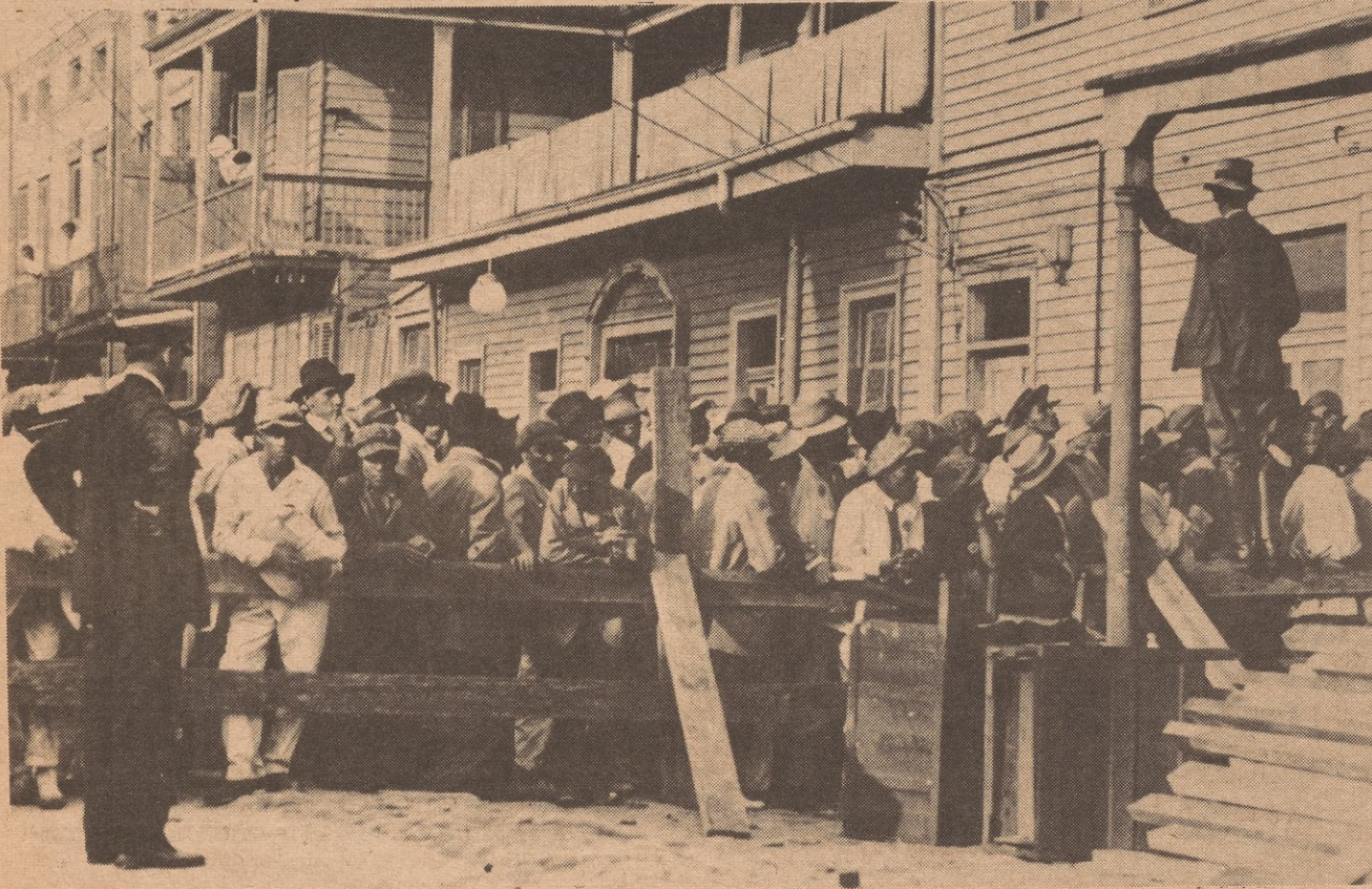
Puerto Ricans in the late 30's registering for the construction of housing in New Orleans.