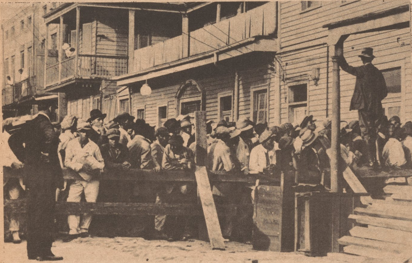
Puertorriqueños en los 30's registrándose para trabajos de construcción en New Orleans.