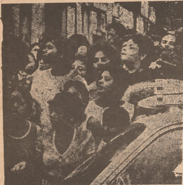
After police arrested suspect in mutilation-murders of 4 little boys, community came to show their concern.