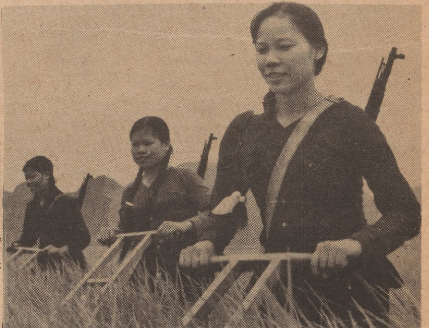
El pueblo Vietnamita lucha contra el gobierno yanqui pero construyen su país a la misma.