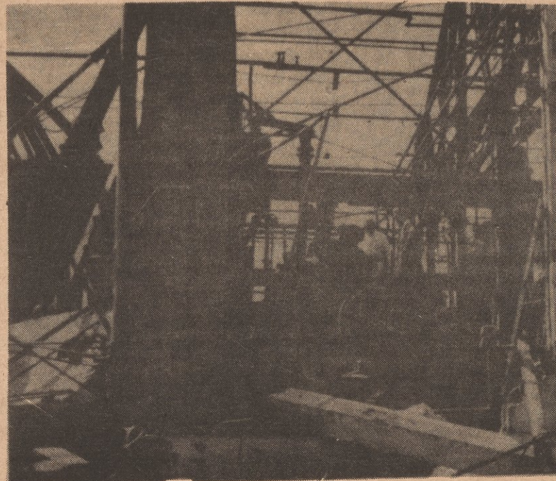
Here is shown 'Ware Chemical' after the explosions.

For covering over, serving, and protecting the company owners in this country and contributing to the accidents, abuses, and deaths of workers each day, this week's Enemy of the People Award is being given to you, Occupational Safety and Health Administration.