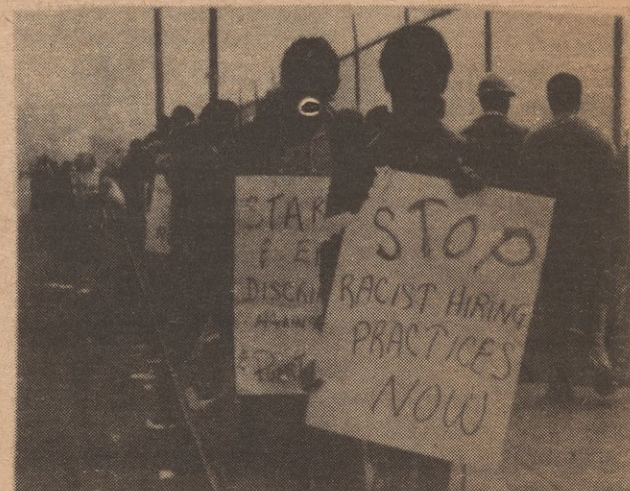
Fight Back demands jobs for Black and Spanish speaking construction workers.

Fight Back asks the community to notify them of sites in the Bronx where there are no Black or Spanish speaking workers and encourages anyone who needs a job to contact them. They also have begun free lunch programs and made available recreation equipment for children. Brother