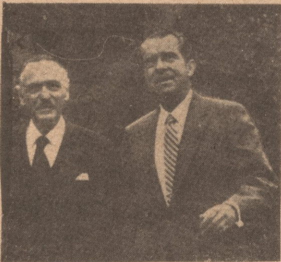
Dos enemigos del pueblo--Ferré y Nixon