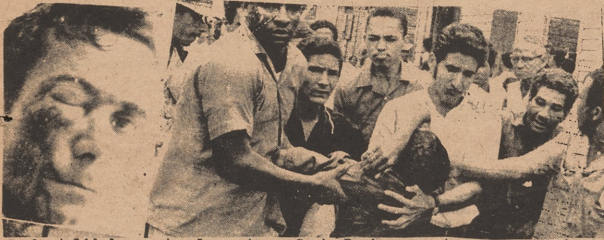
La brutalidades contra la gente en Santo Domingo son tan severo que hasta la vida humana no es respetada.