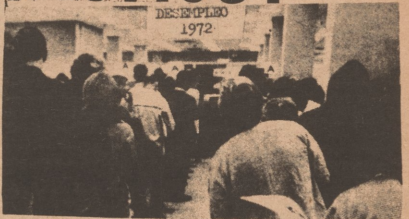
FILAS LARGAS DE DESEMPLEO—PRUEBAS QUE LA POLITICA ECONOMICA DE NIXON ESTA EN EL INTERES DEL RICO!

9. Descualificando trabajadores por no querer