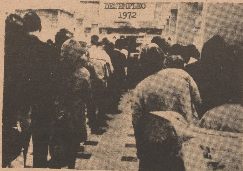
LONG UNEMPLOYMENT LINES ARE PROOF THAT NIXON'S ECONOMIC POLICY ARE IN THE INTEREST OF THE RICH!

Unemployment checks of many workers have been held back in the last months. Also, many workers have been given the run-around in their "efforts" to find jobs. We all know there are very few jobs around. This attack on workers is part of the Nixon-Meskill plan to be reelected. The plan is to gain votes by showing a decrease in unemployment rate. The unemployment rate is based on the number of people collecting unemployment checks. Therefore, by forcing workers to give up their