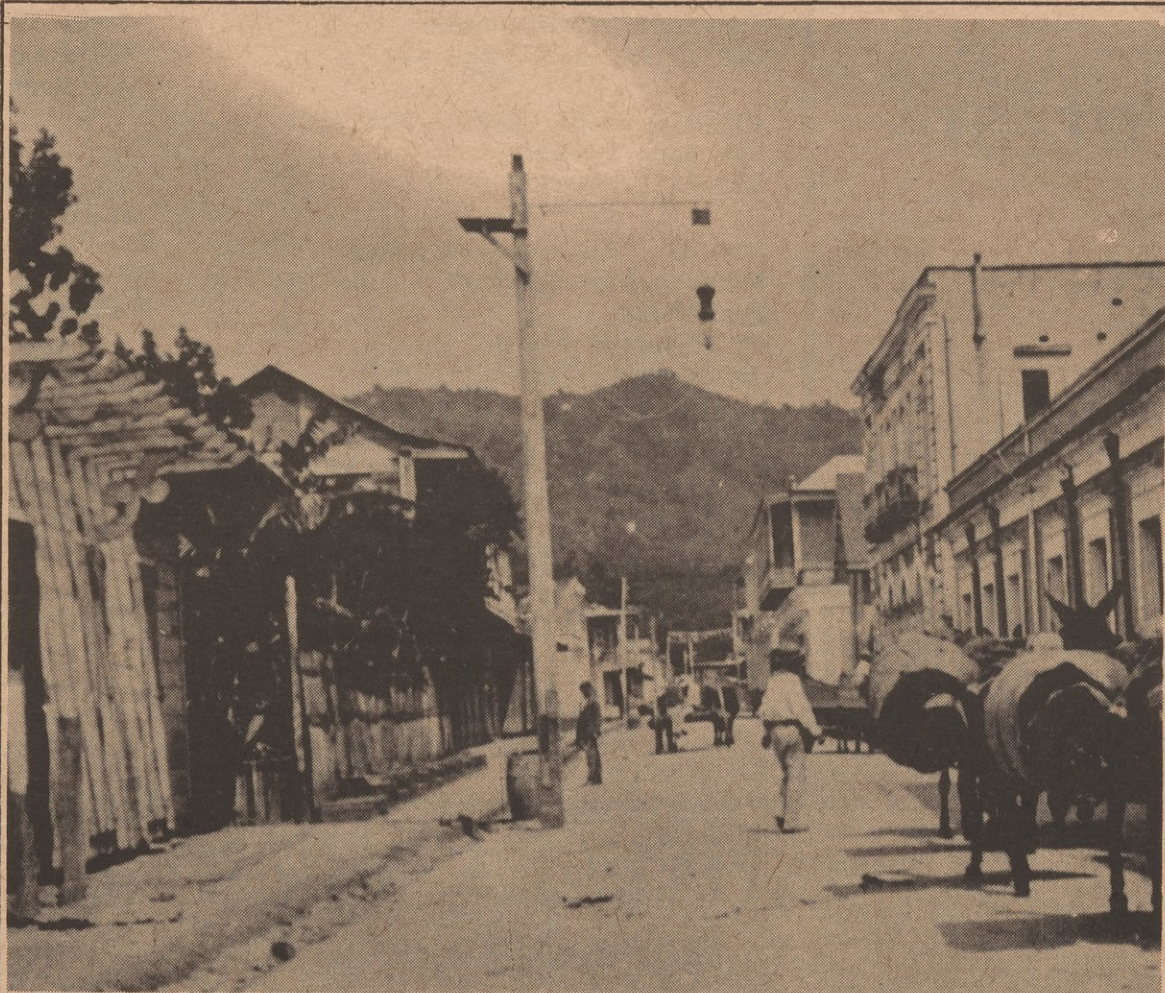
The record 'El Filo del Machete' talks about the Jibaro (peasant). This picture shows the Jibaro in Bayamon, Puerto Rico, 1935.

As capitalism developed, the rich from Spain and later from the