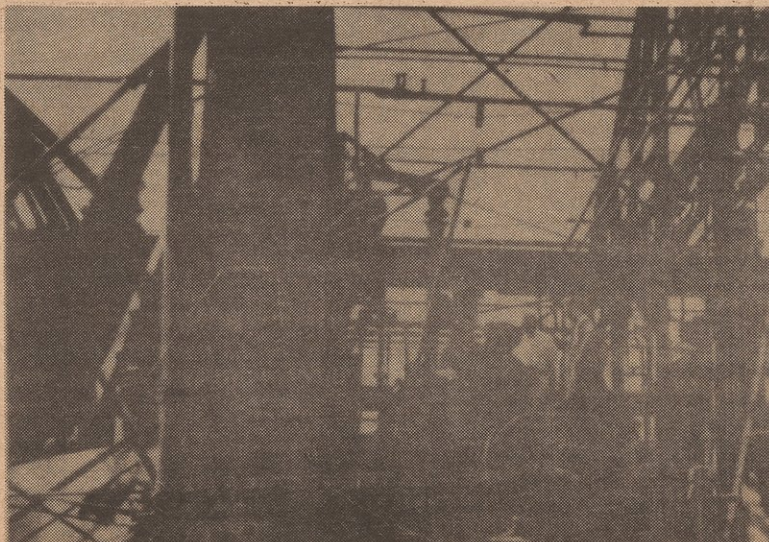
Aquí se ve 'Ware Chemical' luego de las explosiones.

Por servir y proteger a los dueños de las industrias escondiendo evidencias e imputando violaciones que no cubren el bienestar de trabajadores y sus familias, contribuyendo así a que existan accidentes y muertes de obreros todos los días, damos el "premio" de Enemigo del Pueblo a ti administración de salud y seguridad ocupacional.