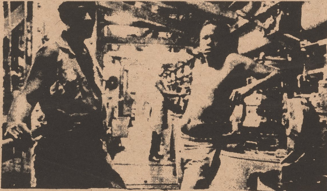
BLACK WORKERS TAKE THE LEAD