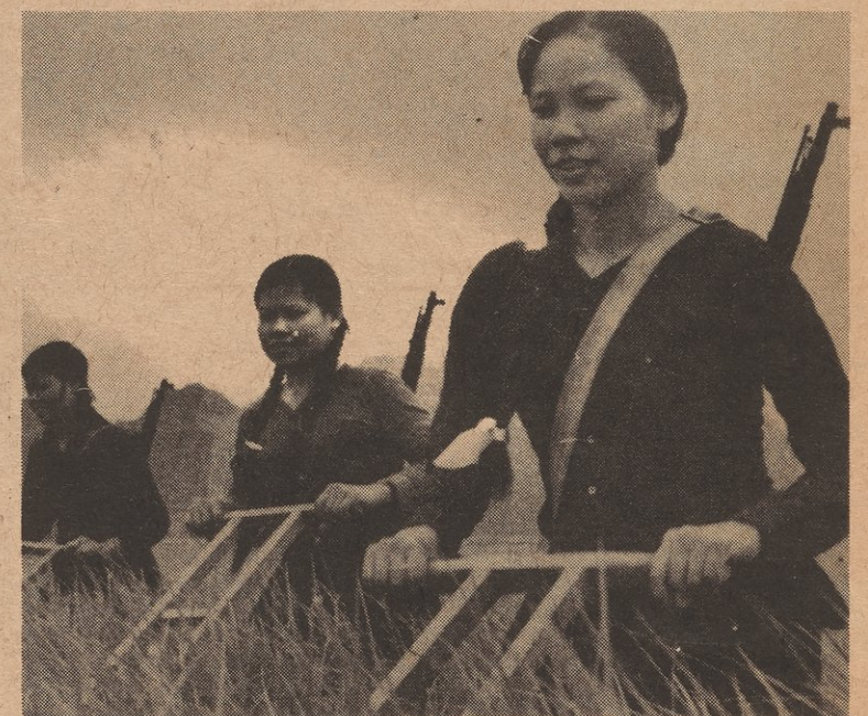
The Vietnamese fight the U.S. gov't but build their country at the same time.