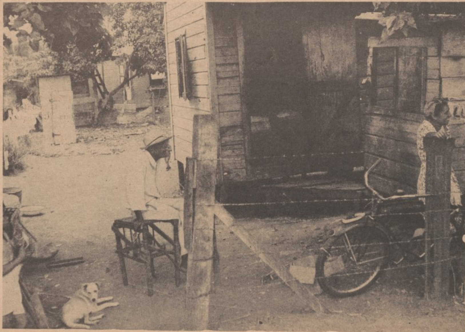
Sugar workers' homes along the roadside