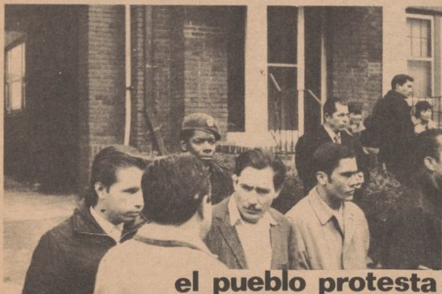
el pueblo protesta