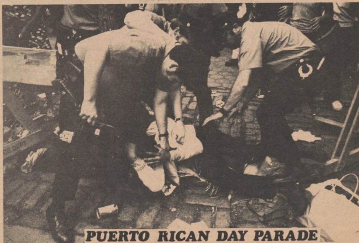
PUERTO RICAN DAY PARADE