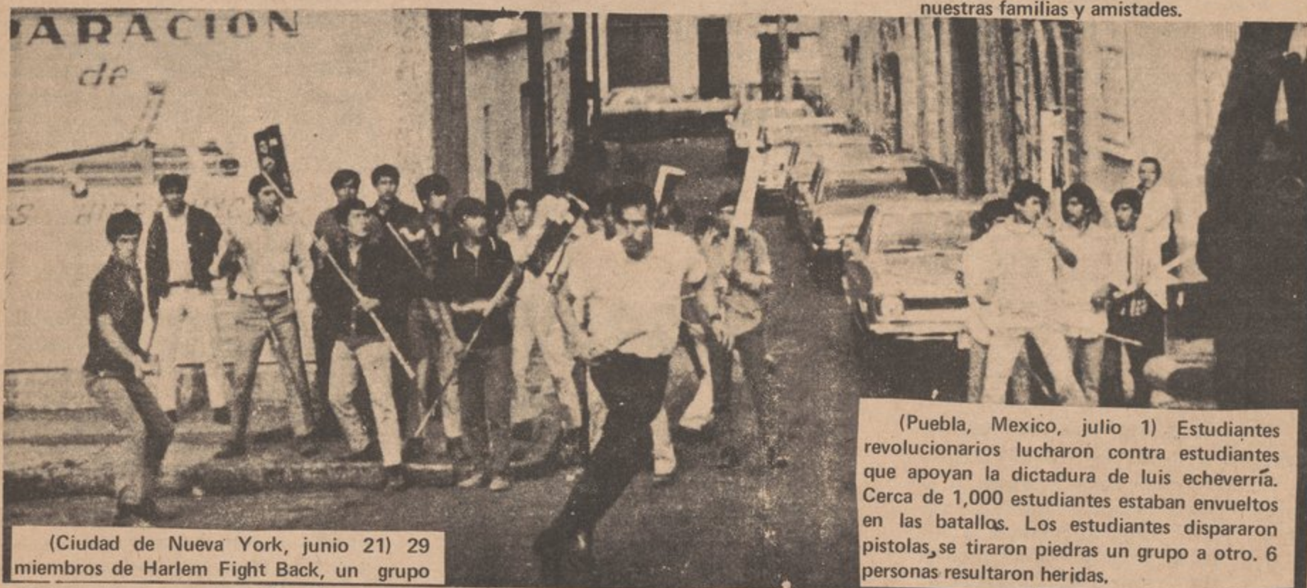
(Ciudad de Nueva York, junio 21) 29 miembros de Harlem Fight Back, un grupo

¿Qué es lo que sucede que nuestros hermanos y hermanas están siendo asesinados a tiros en nuestras calles? Cada comunidad debe organizarse para defenderse y luchar contra aquellos que pretendan hacer daño a nuestras familias y amistades.