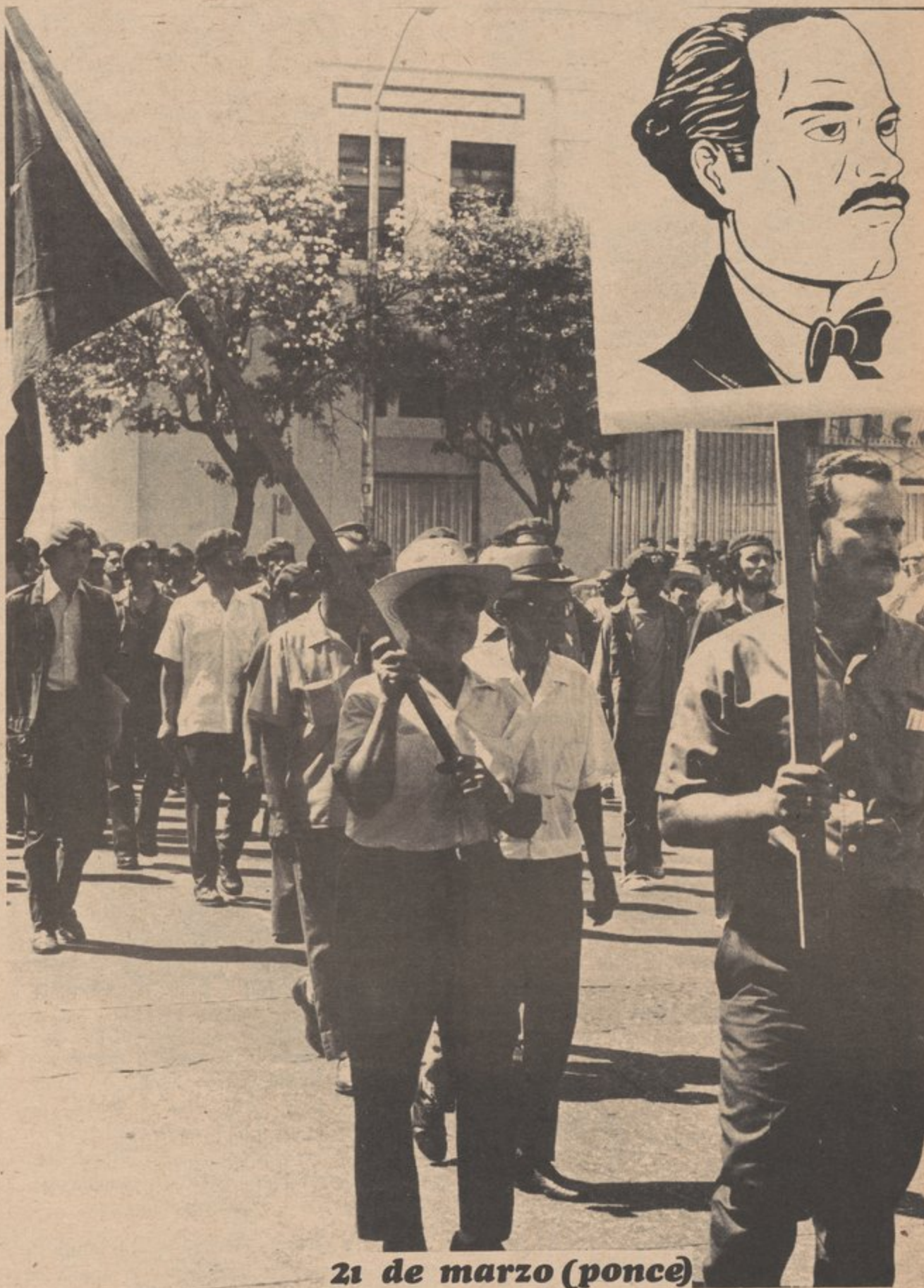
21 de marzo (ponce)

Por el lado positivo, el Partido ha crecido muchísimo en este año, como ha crecido todo el movimiento puertorriqueño. Hemos tenido