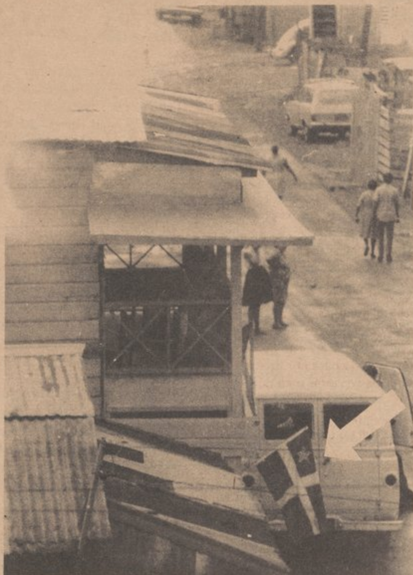
oficina del partido

Las redadas en los arrabales son el mejor ejemplo del abuso policiaco en nuestras comunidades.