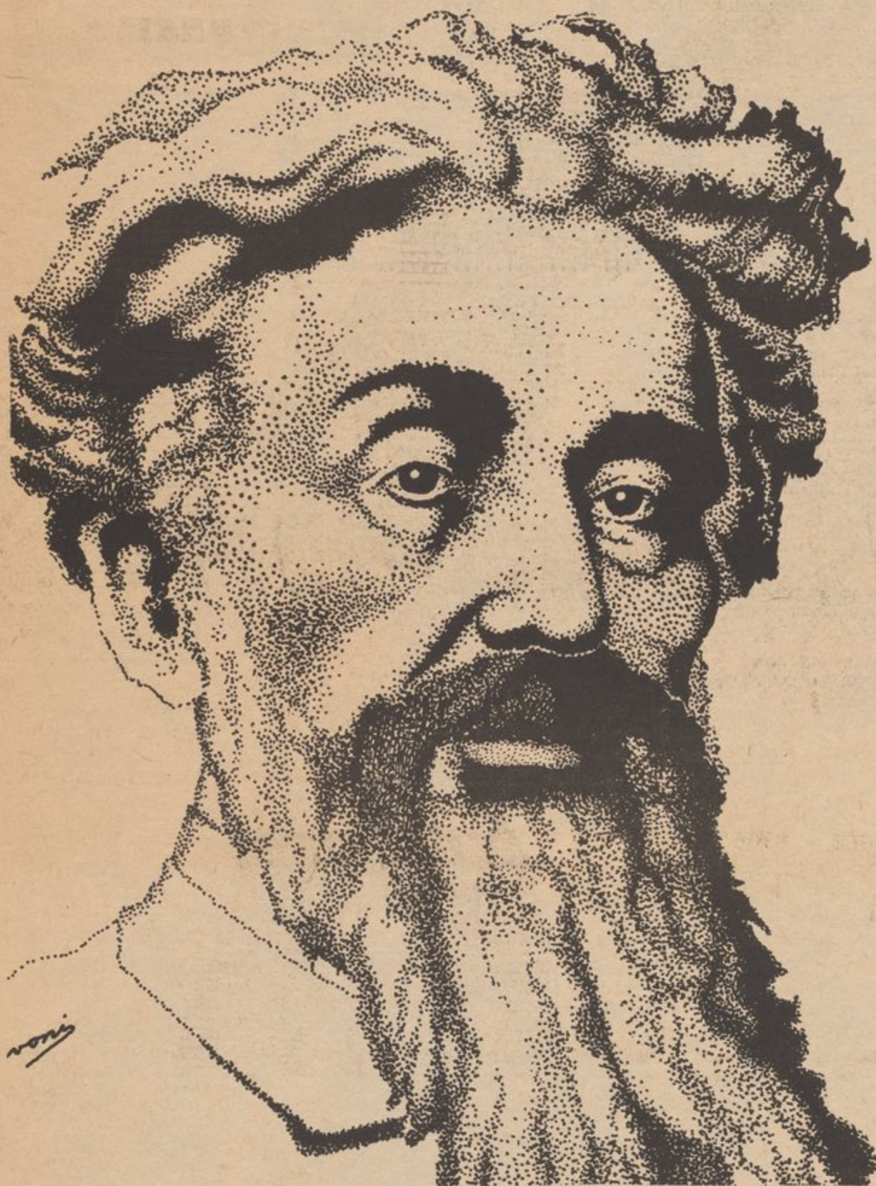
RAMON EMETERIO BETANCES

Esta edición de PALANTE está dedicada a EL GRITO DE LARES y los revolucionarios que en septiembre 23 de 1868 comenzaron la lucha por la liberación. Este año, el PARTIDO DE LOS YOUNG LORDS ha citado para una conferencia de todos los estudiantes Puertorriqueños en los colegios y escuelas superiores, de manera que podamos continuar el trabajo comenzado por nuestros antecesores.