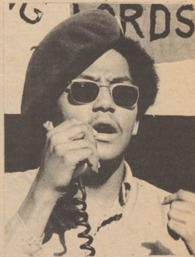
MINISTRO DE INFORMACION YORUBA