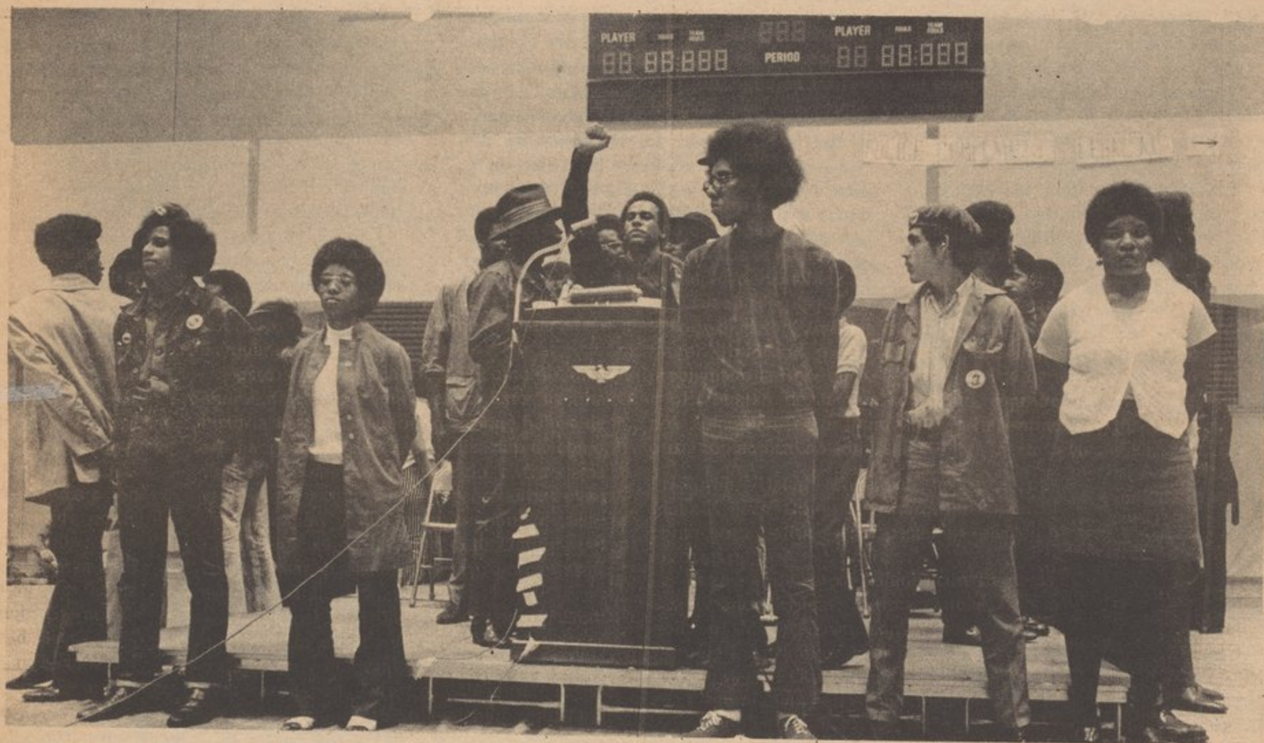
LORDS AND PANTHERS GUARD HUEY

The Constitution itself will be present to the people November 4th at Washington, D.C. On that date, we will all be able to see more clearly the structure of the new society we are