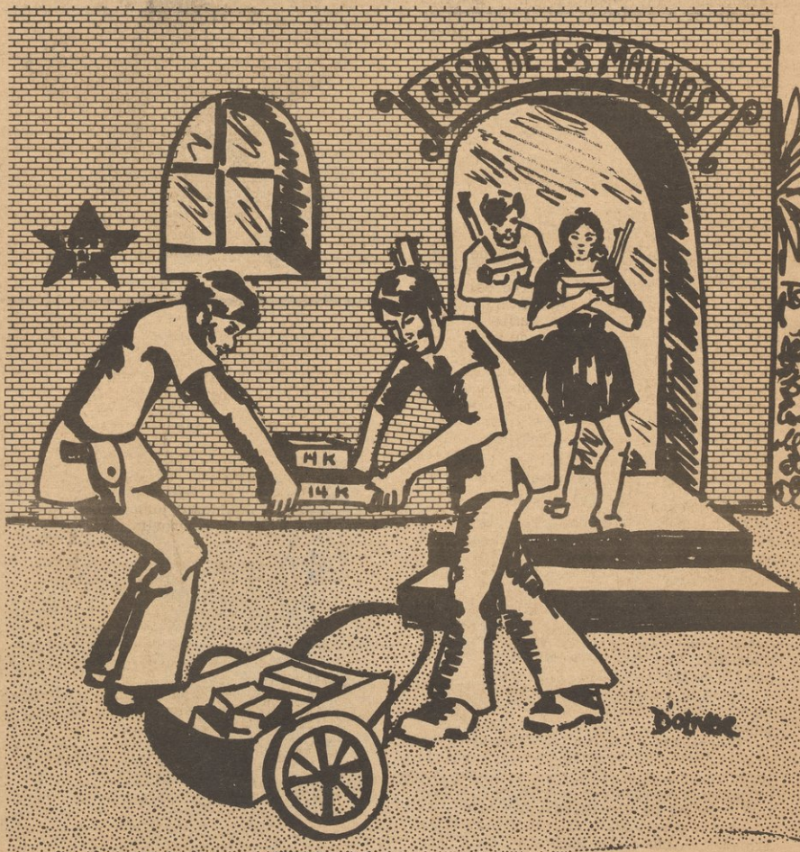
LOS TUPAMAROS LE QUITAN EL DINERO A LOS RICOS Y LO REGRESAN A LOS POBRES