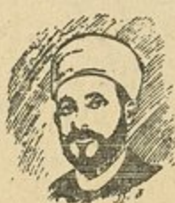
الشيخ احمد طيارة