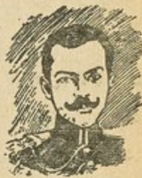
أمين لطفى الحافظ