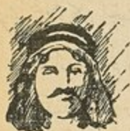
عبد القادر الجزائري