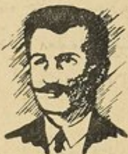
الأمير عارف الشهابي