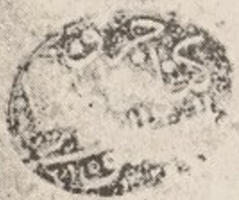
الصفحة الاولى من نسخة (ص)

كتاب في... الى... طالب... الجليل السيد... اي... محمد بن محمد بن محمد... محمد بن محمد بن محمد... بن يوسف بن محمد... بن موسى الديكاطم... عليه... السلام... والله اعلم