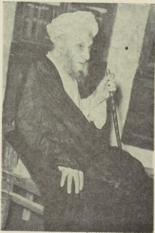
هذه صورة العلامة الكبير شيخنا آقا بزرگ الطهراني مؤلف الذريعة إلى تصانيف الشيعة رضوان الله تعالى عليه