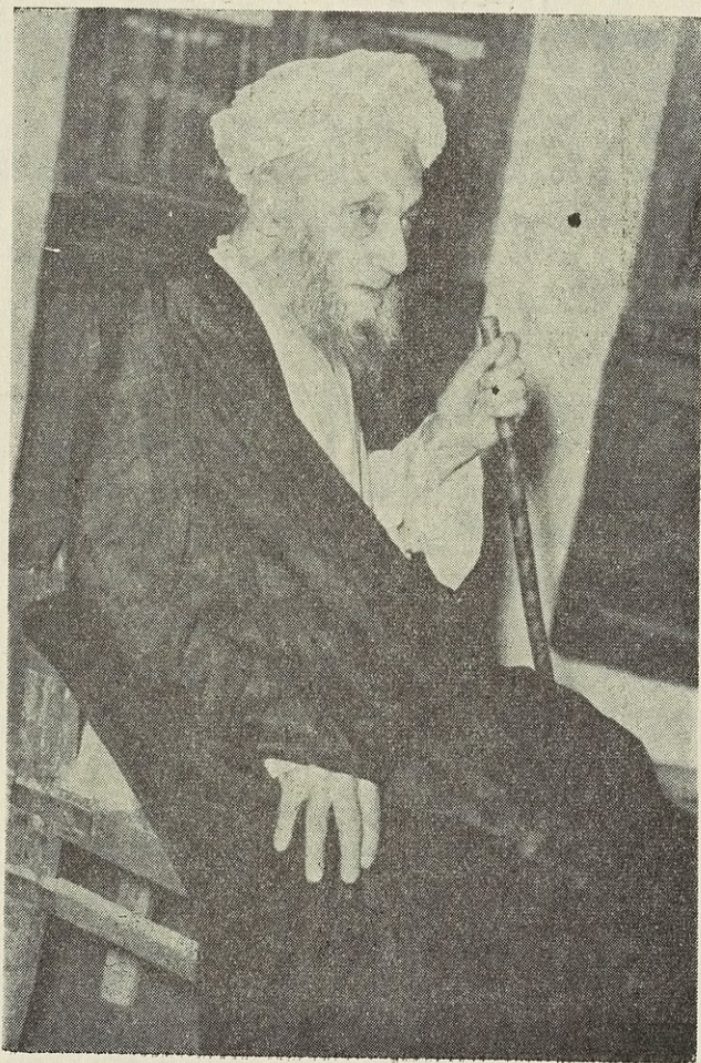
هذه صورة العلامة الكبير شيخنا آقا بزرك الطهراني مؤلف الذريعة إلى تصانيف الشيعة رضوان الله تعالى عليه