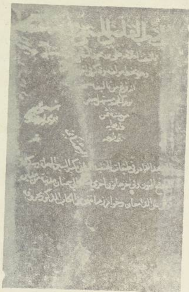
صحيفة الفلاف من النسخة المعتمدة