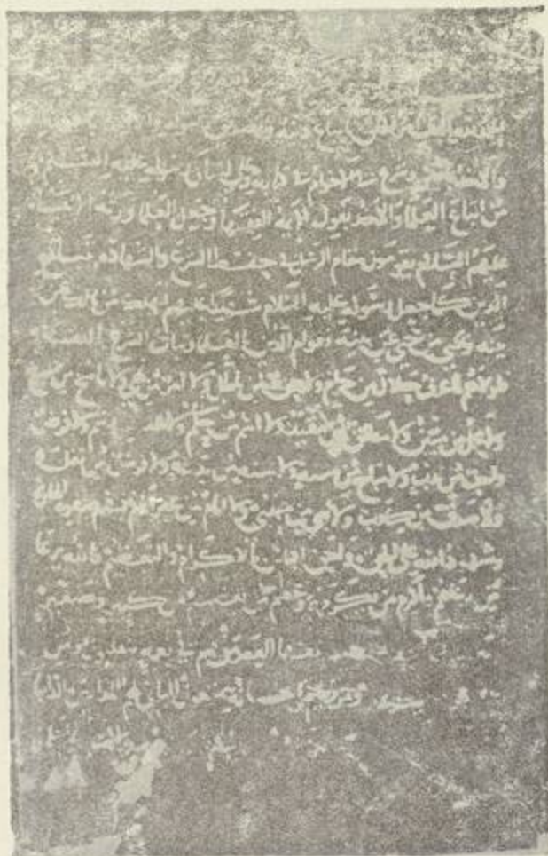
اول صحيفة من النسخة المعتمدة