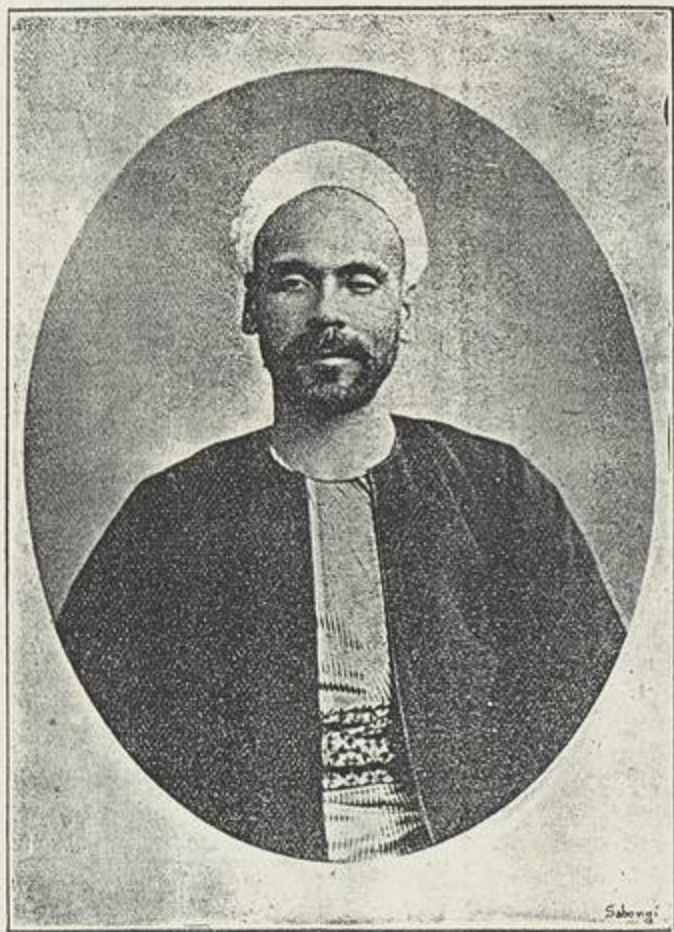
﴿ صورة المؤلف ﴾