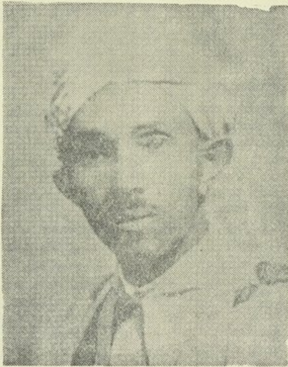
الزعيم الارتيري الشهيد عبدالقادر كبري

في ١٩٤٧ ومؤامرة ١٩٤٨ . . نعم كل الفرصة امام شعب ارتيريا لان يمنع حدوث نكبة فلسطين ثانية وليصمد الشعب الاعزل في ارتيريا في عزلته وخيامه وفقره ووحدايته مادام الآلاف من الشباب المجاهد انطلق يعانق السلاح مصممين على انتزاع النصر النهائي بالدم فقط بالدم ثمناً للكرامة والحرية . . التي منحها الله لكل عباده دون تمييز او تفریق .