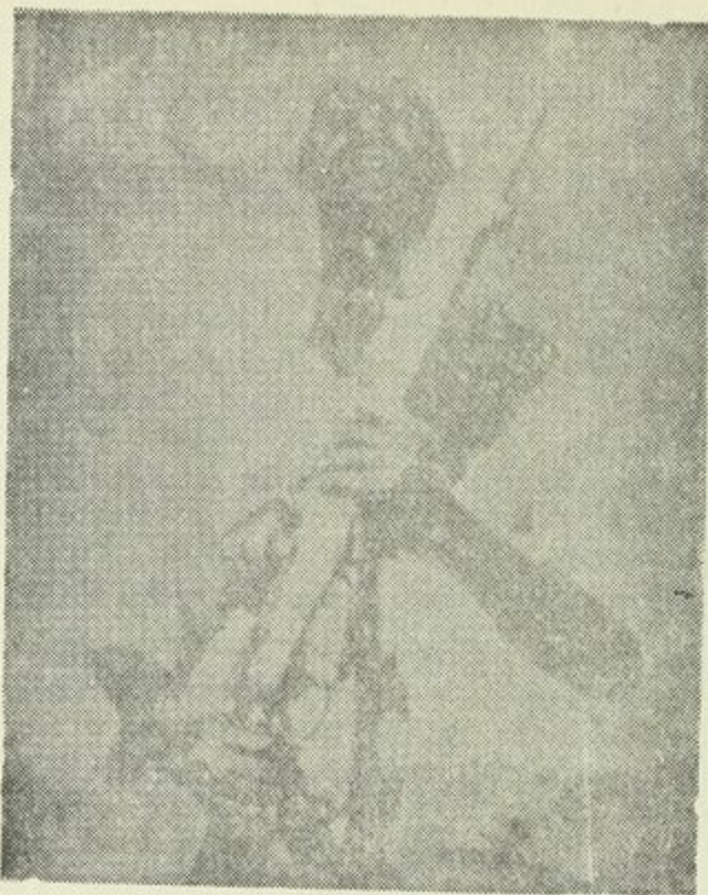
قائد الثورة الأرتيرية المسلحة الشهيد حامد ادريس عواتي