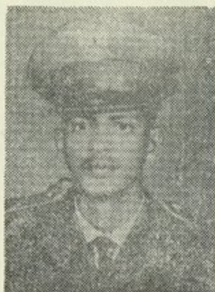
الشهيد البطل محمد علي سعدا