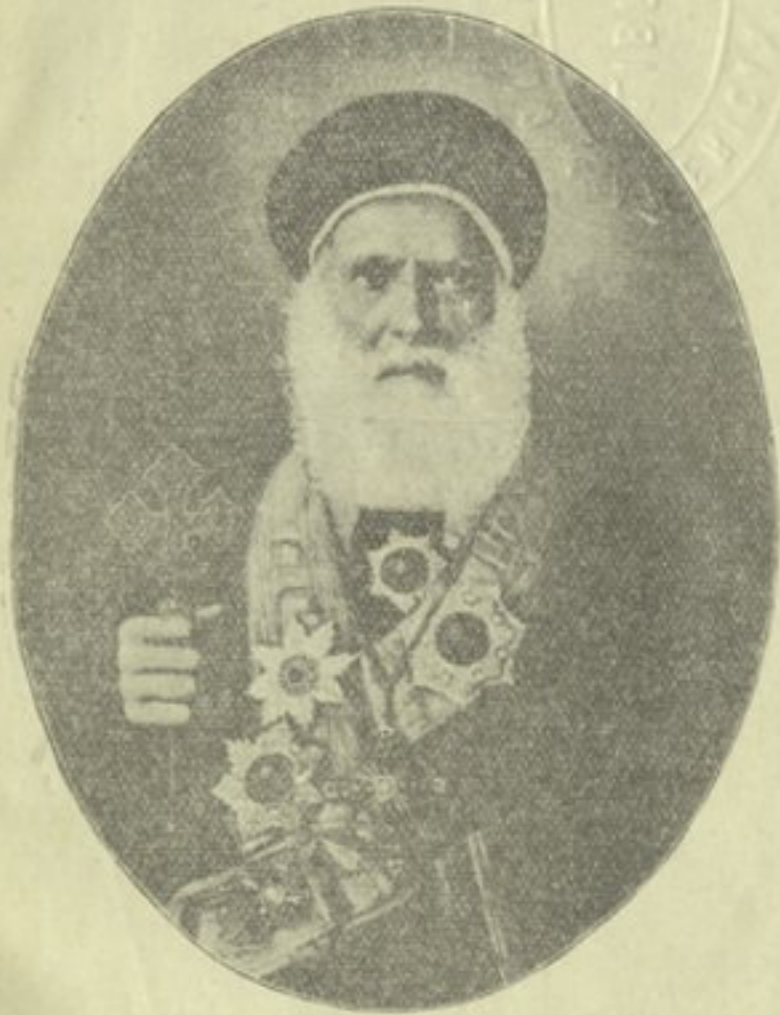
غبطة سيدنا البابا كيرلس الخامس بطريرك الكرازة المرقسية